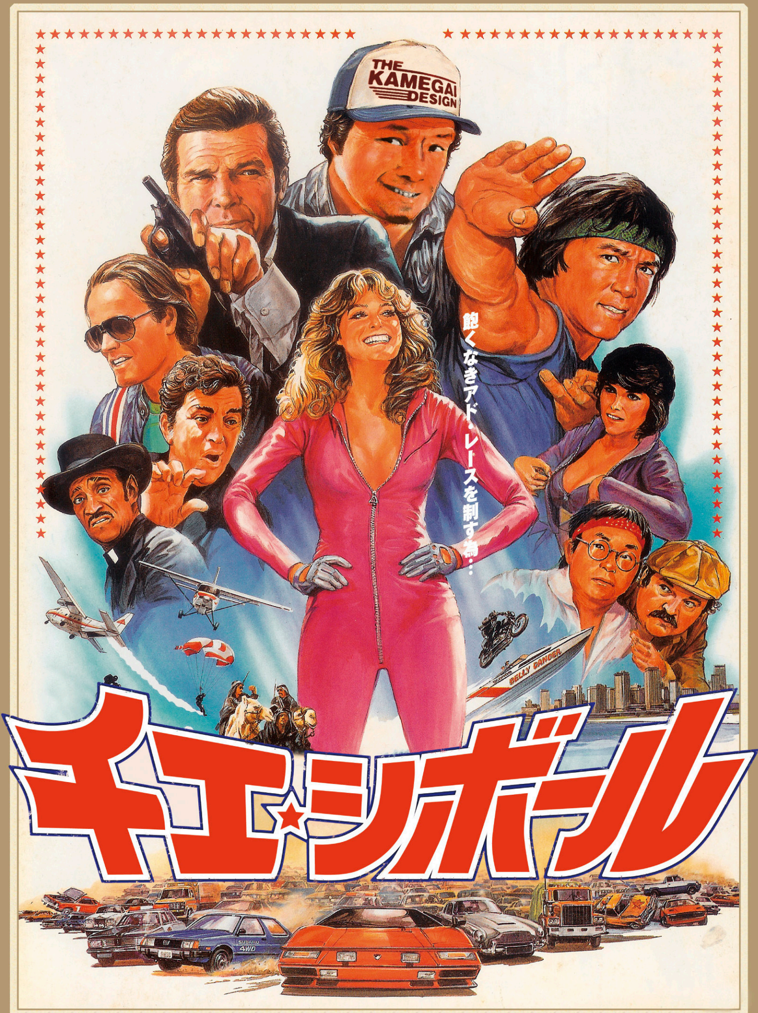
詳しくは裏面をご覧ください。